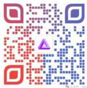
扫一扫, 点击商家入驻